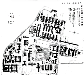
本郷キャンパス構内配置図 明治19年（上） 大正元〜7年（中） 昭和12年（下） 東京大学施設部蔵