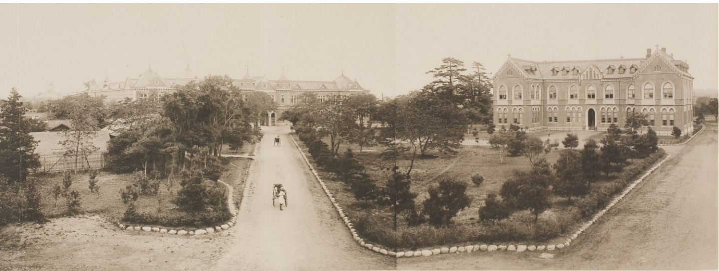
東大正門から眺望した工科大学（左）と理科大学動物学及地質学教室（右）（小川一真『東京帝国大学』1900所収，東京大学文書館蔵）

2018年10月28日（日） 13:30-17:20 東京大学 情報学環 福武ホール 地下2階